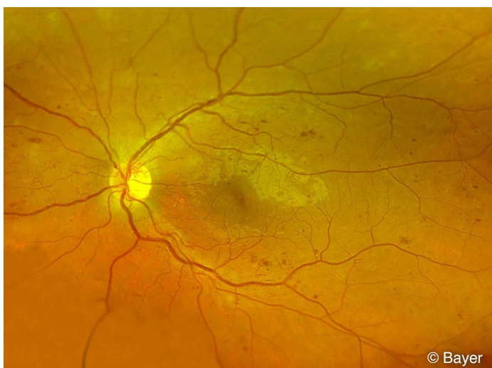
Netzhautbild diabetische Netzhauterkrankung mit typischen Punktblutungen

Eine regelmäßige Untersuchung des Augenhintergrundes ermöglicht es, diabetische Veränderungen rechtzeitig zu erkennen und zu behandeln. So können schwere Verlaufsformen der Erkrankung in der Regel verhindert werden. Der Augenhintergrund kann mit dem Augenspiegel durch die erweiterte Pupille oder auch durch die Weitwinkel-Laserscanning Ophthalmoskopie ohne Erweiterung der Pupille untersucht werden. Je nach Schweregrad und Beschwerden können weitere Untersuchungen wie z.B. die optische Kohärenztomographie (OCT) oder eine Fluoreszenzangiographie erforderlich werden.